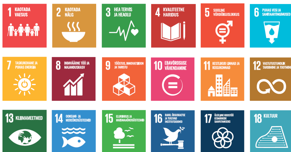
Joonis 2. Kestliku arengu eesmärkide piktogrammide 1

Ka Eestis on aeg realiseerida riigihangete ostujõust tulenev strateegiline potentsiaal ning toetada meie riigile oluliste eesmärkide saavutamist, sh keskkonna-, sotsiaal- ja majanduspoliitikat.